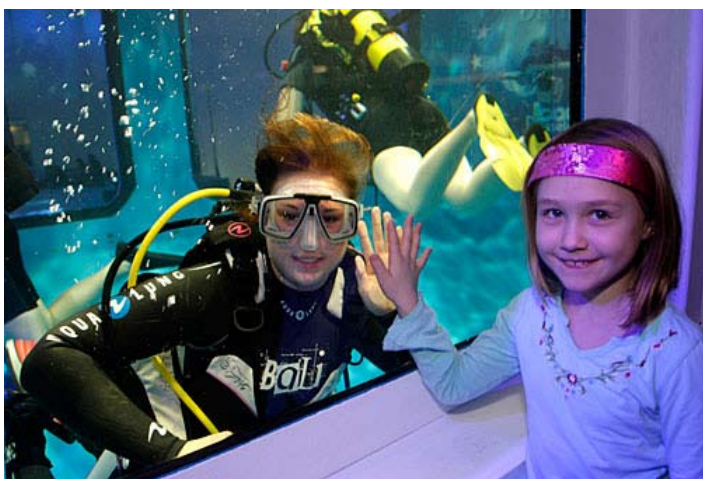
»Atrakcija, ki na potapljaških sejmih vedno vžge«