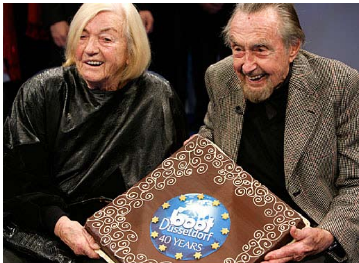
»Pionir potapljanja Hans Hass z ženo Lotte«

Na grobo lahko ocenim, da so na svoj račun prišli podvodni fotografi in potapljači željni novih avantur. Prisotna je bila množica agencij, ki ponujajo najrazličnejše potapljaške lokacije po celem svetu. Vabilu na sejemsko zabavo prijateljev iz Južno