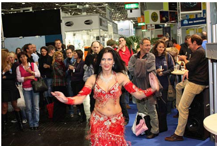
»Eurodiver je za popestritev najel trebušno plesalko«