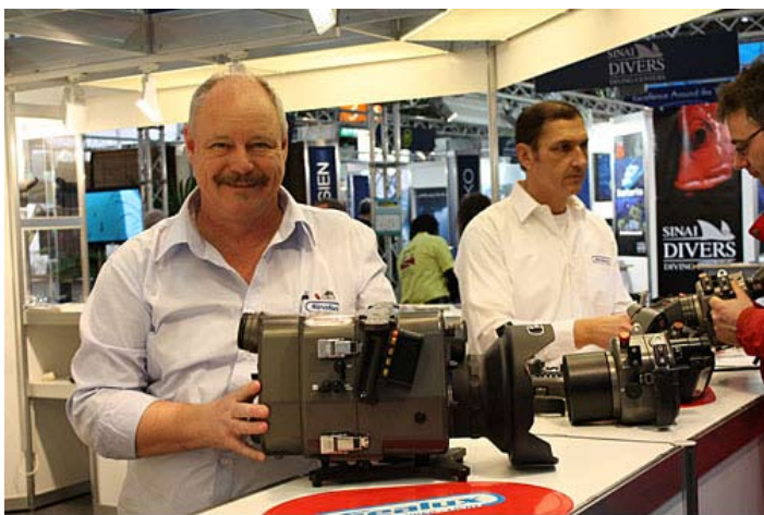
»Sealux ohišje za Sony PMW-EX1«