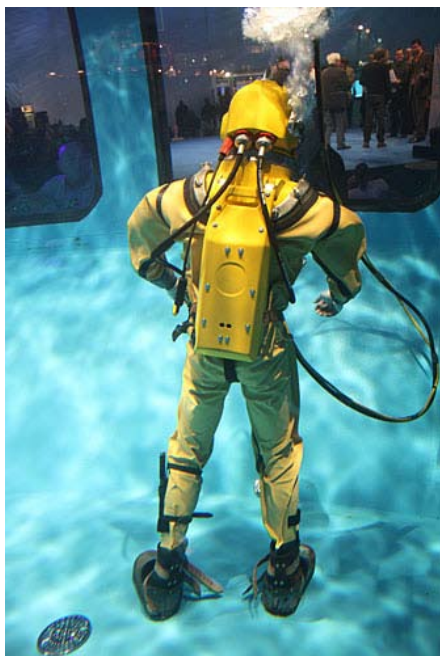
»Demonstracija podvodnega dela«

Italijanski Nimar je predstavil novo linijo univerzalnih ohišij za video kamere, a tokrat iz aluminija, kar je novost, saj so do sedaj izdelovali le poli-karbonatna ohišja. Sledijo še ostali izvrstni proizvajalci foto in video opreme, vendar je skrbno odmerjen prostor tega članka premajhen, da bi opisal vse.