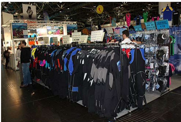
»Ugoden nakup po sejemski ceni«

Čeprav na sejmu nisem videl kaj posebno novega, mi bodo v spominu ostala srečanja in prijetni trenutki. V času internetnega marketinga pravzaprav proizvajalci ne skrivajo več novitet za sejme, tako je sejem postal prostor za druženje in osebne stike. In tega se zelo veselim, torej, vidimo se naslednje leto v Düsseldorfu.