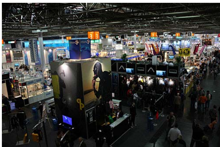
»Potapljaška hala 3, Boot 2009«